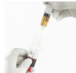
Bereit zur Injektion

Bei der PRP/ACP-Therapie werden aus dem körpereigenem Blut nach venöser Abnahme und Zentrifugation das eigene Plasma mit den konzentrierten Wachstumsfaktoren an oder in die Gelenke bzw. schmerzhaften Areale gespritzt.